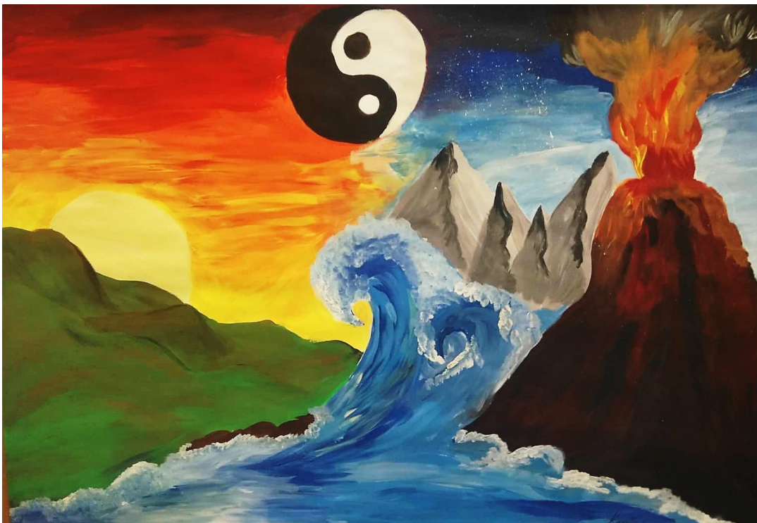
Kateřina Konečná, 2. PL