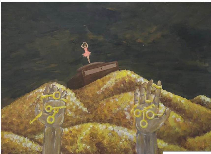
Klára Drabinová, 2. PL